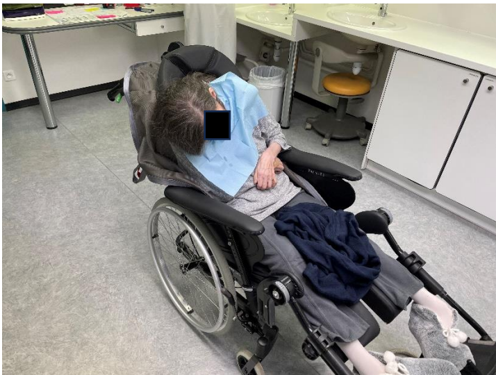
Des soignants formés à la prise en charge du patient âgé dépendant.