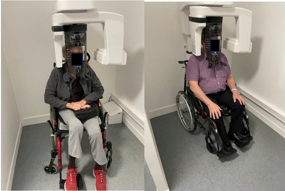
Des structures de soins adaptées au patient âgé dépendant.