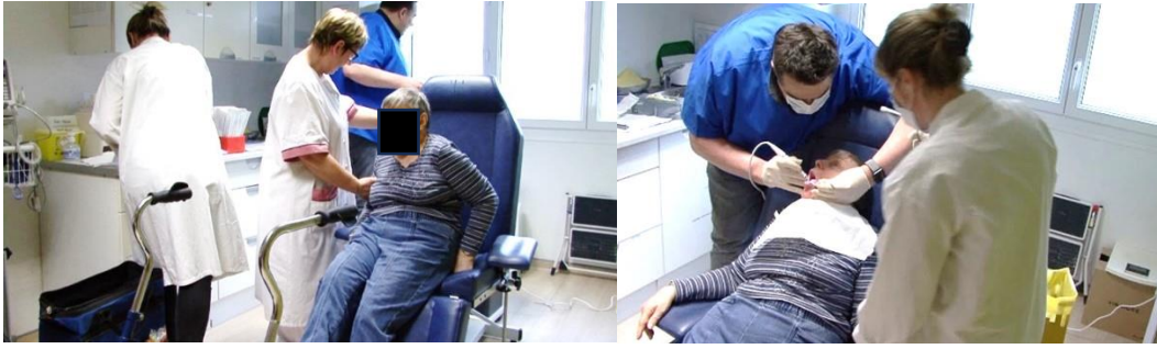
Des soignants formés et équipés pour des soins à domicile ou en structures dans le cadre du « aller vers »