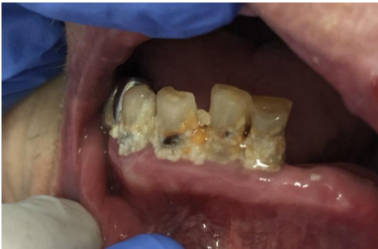
Une santé bucco-dentaire non compatible avec une bonne santé générale et une bonne nutrition (70 à 90 % des résidents en EHPAD ont besoin de soins bucco-dentaires).