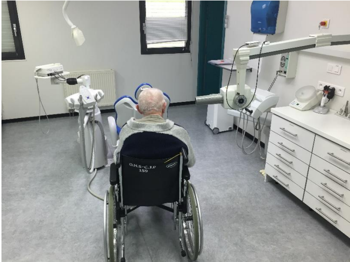
Des structures de soins adaptées au patient âgé dépendant.