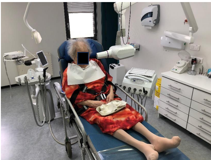
Des structures de soins adaptées au patient âgé dépendant.